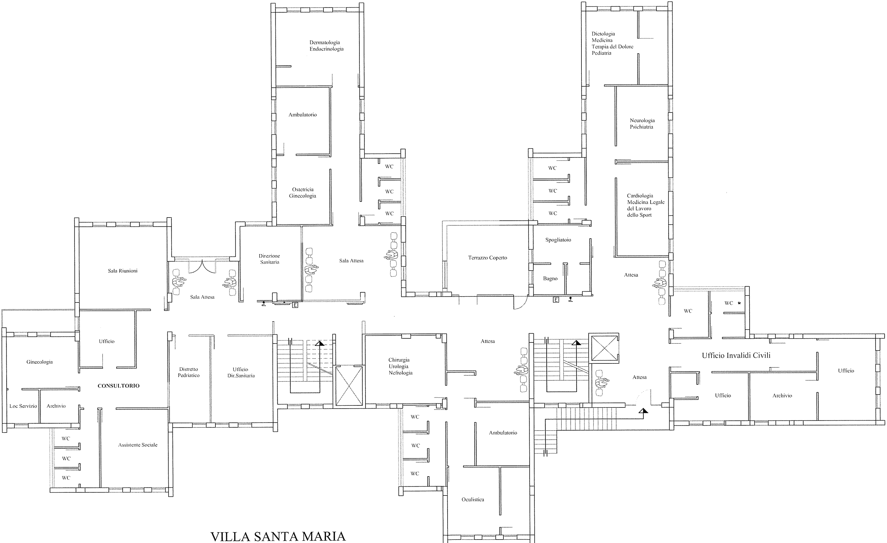
VILLA SANTA MARIA PIANTA PIANO PRIMO