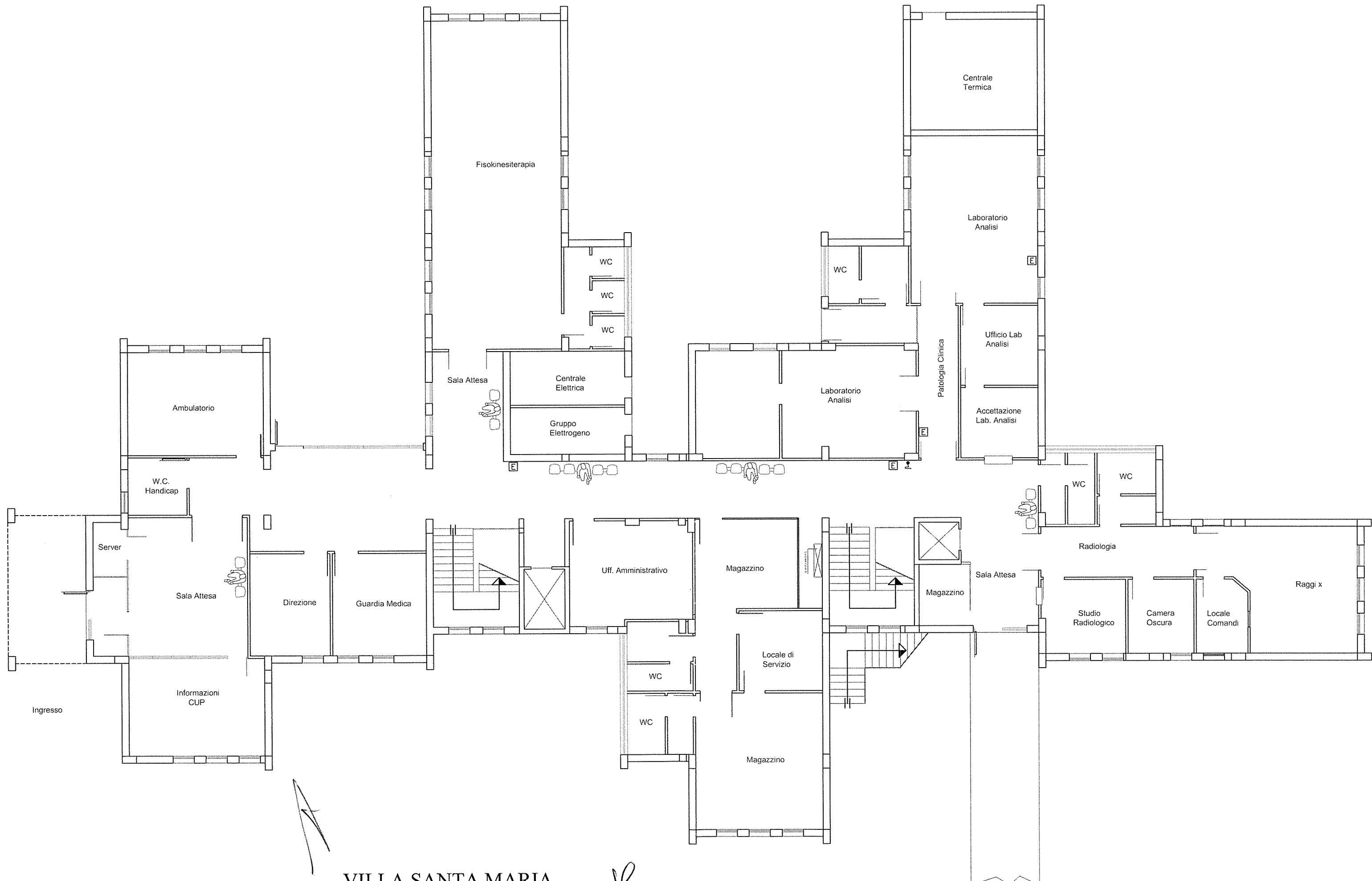
VILLA SANTA MARIA PIANTA PIANO TERRA